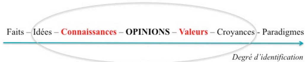
Figure 1 : Les fondements de l'opinion, par ordre croissant d'attachement et d'identification individuelle